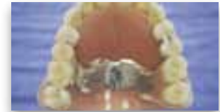
ZERAM SNAPKRONEN aus der Draufsicht (jeweils mit und ohne herausnehmbare Zähne)

Die SNAPFEDERN bestehen aus einer goldfreien Cobaltlegierung. Damit Ihr Lächeln schön weiß bleibt, werden die SNAPFEDERN nach Möglichkeit in unsichtbare Bereiche gelegt. Vor der Anfertigung zeigen wir Ihnen ganz genau, wo die SNAPFEDERN eventuell zu sehen sind.