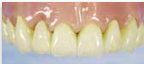
Perfekt, sicher & stabil – die fertigen ZERAM® DOPPELKRONEN

Die aus Innen- und Außenkronen bestehenden ZERAM® DOPPELKRONEN sind bewährte und komfortable Verbindungselemente der Ersatzzähne zu den eigenen Restzähnen im Mund.