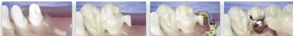
Abbildung links: vorbereitete Zähne; mitte: fest zementierte Zeram Kronen und herausnehmbare Zähne von unten; rechts: eingesetzte Zähne

ZERAM® GESCHIEBE und ZERAM® RIEGEL sind Kombinationen aus festzementierten ZERAM® KRONEN mit herausnehmbaren Zähnen. Die herausnehmbaren Zähne werden mit Geschieben oder Riegeln an den festen ZERAM® KRONEN oder -BRÜCKEN verbunden. Diese Lösung bietet ein bestmögliches ästhetisches Ergebnis und einen sehr hohen Kaukomfort. Voraussetzung für diese Möglichkeit sind gesunde Zähne mit einer sehr guten Prognose für die festen ZERAM® KRONEN. Ein späteres Anpassen nach dem eventuellen Verlust einzelner ZERAM® KRONEN ist nicht möglich.