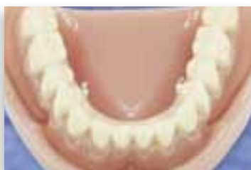
Abbildungen unten: COBAK® STEG im Unterkiefer auf vier Implantaten. Die „Herausnehmbaren“ sind doppelt gesichert: über die präzise Metallpassung und mit zwei kleinen Riegeln auf der Innenseite.