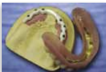
Abbildungen oben: ZERAM® STEG im Oberkiefer auf sechs Implantaten mit Feingoldpassung zu den herausnehmbaren Zähnen – komfortabel in der Handhabung und sicher im festen Sitz.