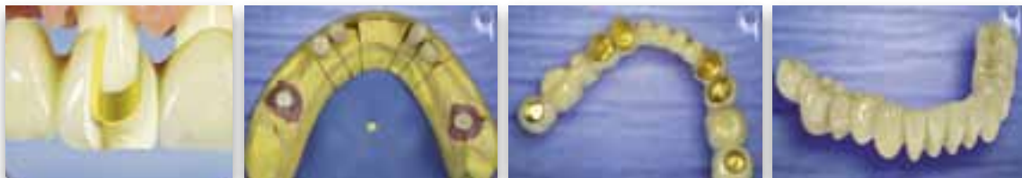
Abbildung 1.) Das Funktionsprinzip. 2.) Draufsicht auf einen Unterkiefer mit ZERAM® DOPPELKRONEN auf vier natürlichen Zähnen und zwei Implantaten. 3) Innenansicht der „Herausnehmbaren“. Die Außenkronen aus Feingold passen präzise auf die Innenkronen. 4) Die optimale Anzahl und Verteilung der ZERAM® DOPPELKRONEN lässt eine kosmetisch ansprechende und komfortable Gestaltung der herausnehmbaren Zähne zu.

Das Grundkonzept basiert auch hier auf einer sicheren und komfortablen Verankerung der neuen Zähne bei gleichzeitiger Möglichkeit, sie für die Mundhygiene kurz herauszunehmen. Die für ZERAM® STEGE genannten Vorzüge gelten auch für ZERAM® DOPPELKRONEN. Zusätzlich wertvoll bei ZERAM® DOPPELKRONEN ist die Option, einzelne eventuell noch vorhandene Zähne und Implantate zu kombinieren. Zähne und Implantate werden mit Innenkronen aus belagabweisender Keramik versehen. Diese Innenkronen werden fest auf Ihre vorbereiteten Zähne oder auf die Implantat-Aufbauten geklebt. Mit Präzisions-Gegenstücken aus Feingold können die Außenkronen mit den neuen Zähnen auf die Innenkronen aufgeschoben werden. Bei vier bis sechs solcher ZERAM® DOPPELKRONEN kann langfristig ein sehr angenehmes Ergebnis erreicht werden.